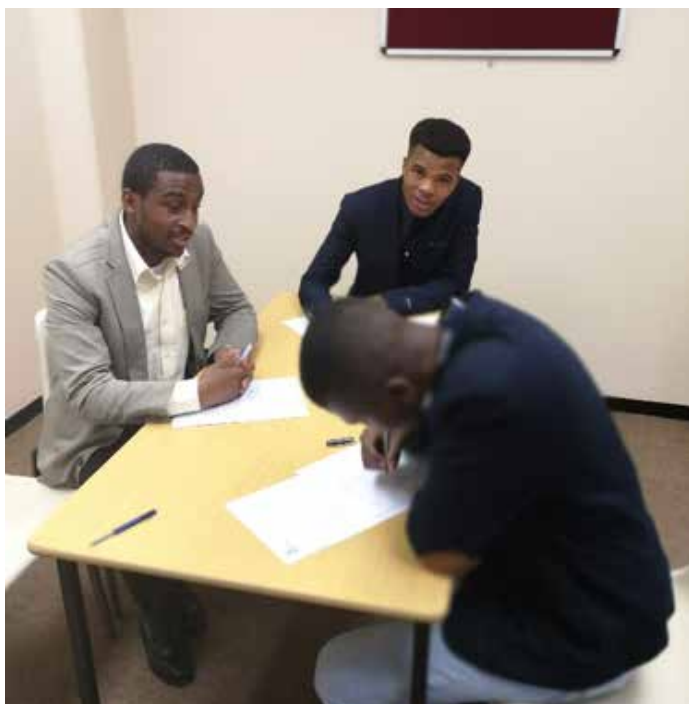
Baithuti ba maqwetha ba rupellwang mane Polokwane ba phetha tekolo e ngolwang

Ka Loetse 2017 Ofisi ena e ile ya qala ka mosebetsi wa ho thaotha baithuti ba tla kena Thupelong ya Baithuti ya Pherekong 2018. Tshebetso ena ya ho thaotha e ile ya etsa hore ba Ofisi ba ye dikolong tse fapaneng tsa molao ka hara naha tse neng di kenelletsa Durban, East London, Polokwane le Cape Town.