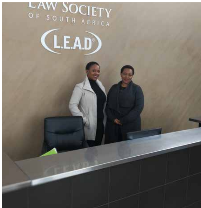
East London Law School